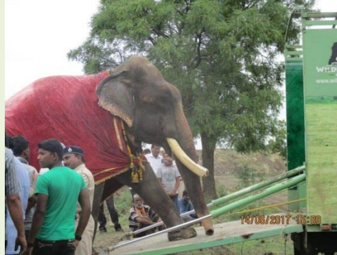
上圖：Gajraj 被鍊乞討受虐 51 年