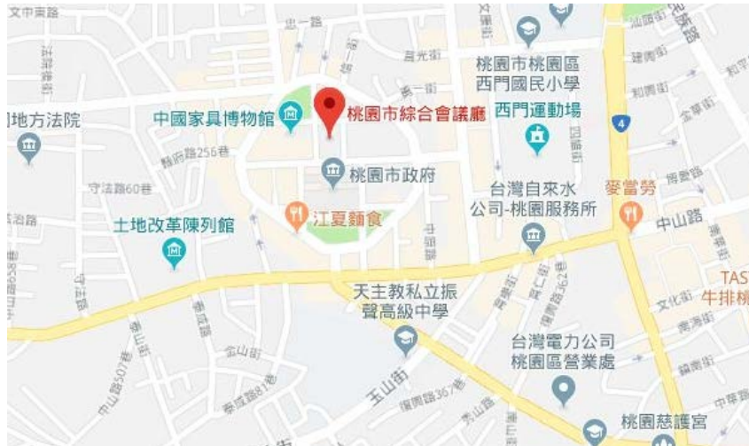
圖 2、桃園市綜合會議廳交通地圖