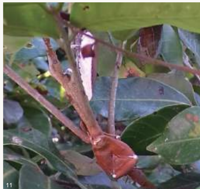
圖10~11. 108年梅雨季前後,大量荔枝椿象若蟲及成蟲感染蟲生真菌而死亡僵直掛在樹上,蟲體內白色黴菌從觸角、足、胸腹部等節間或氣孔、臭腺開孔長出。