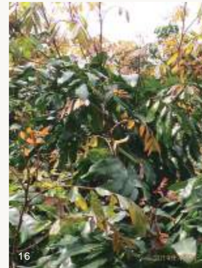
圖16~17. 龍眼葉芽如正常生長，應該會長出許多紅嫩枝葉（上圖）並正常展開逐漸變青綠。但如果發生鬼帚病（下圖），則葉芽無法展開，且組織增生毛呈現簇生狀乾枯情形，開花率亦會降低。

高雄大崗山一帶地區龍眼鬼帚病相當普遍，惟截至目前為止仍無法證實此病徵為荔枝椿象媒介不明病原造成；然而卻有愈來愈多證據顯示可能是因為節蟬數量暴增取食汁液，而使龍眼葉芽組織變形增生枯萎，導致樹葉無法展開且開花率降低。