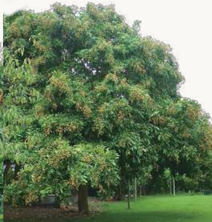
圖2. 在非農業區的低海拔山丘或平地老聚落、廟宇、公園等地極為常見無人管理之高聳散生植株。