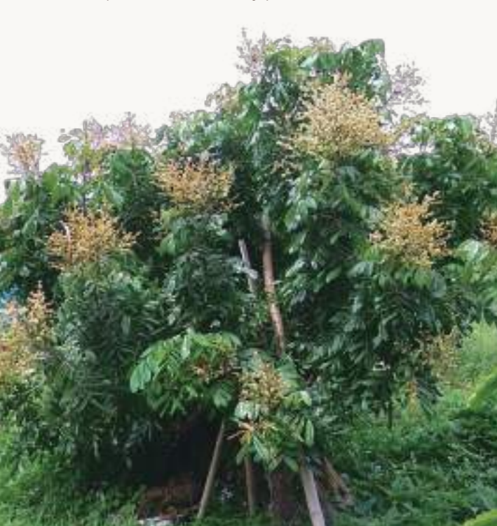
圖1. 龍眼為常綠喬木,在農業區為矮化集約式經營經濟作物。