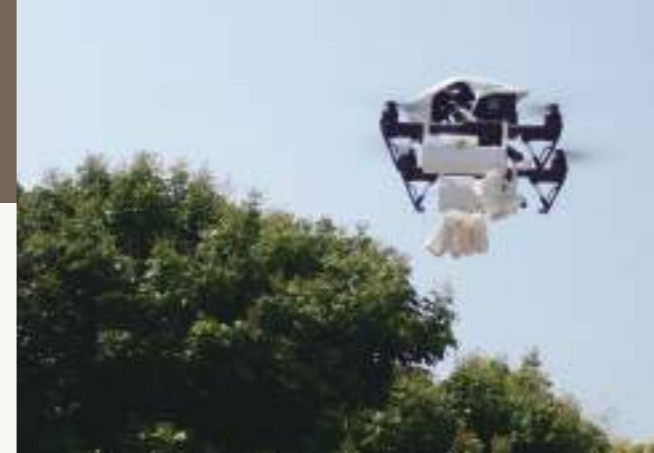
圖20. 利用無人機投放平腹小蜂卵片，進行生物防治，殺死荔枝椿象卵。