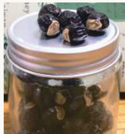
圖3. 龍眼果實似龍目,古詩云「圓如驪珠,赤若金丸,肉似玻璃,核如黑漆」。

荔枝椿象( Tessaratoma papillosa )屬半翅目(Hemiptera)、荔椿科(Tessaratomidae),為荔枝及龍眼常見的害蟲,分布於泰國、越南、寮國、香港及中國等地,遲至1997年首次在金門發現,2009年則首次在臺灣高雄發現,目前除澎湖縣尚未發現、臺東縣、花蓮縣零星分布外,已經在臺灣各縣市普遍發生,其寄主植物主要為無患子科(Sapindaceae)植物包含荔枝( Litchi chinensis )、龍眼( Dimocarpus longan )、無患子( Sapindus mukorossi )及臺灣欒樹( Koelreuteria henryi )等四種喬木。