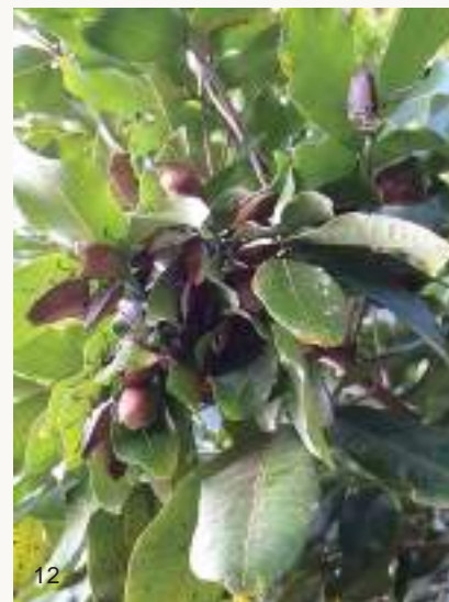
圖12~13. 荔枝椿象在龍眼葉下聚集越冬，此時進入生殖系統發育停止或緩慢的繁殖滯育期，此時不太活動，在樹下通常聞不到椿象臭味。

在臺灣，無患子與臺灣欒樹從10月開始漸漸枝葉稀疏，新羽化的荔枝椿象並不交配，漸漸飛離，銷聲匿跡。有部分可能分散飛至不明處所躲藏，然而它們曾被發現聚集在龍眼樹的葉背，且以成蟲方式度過日照漸短的秋冬。一般在龍眼樹下也以為荔枝椿象都飛走了，因為此時已聞不到椿象臭味。