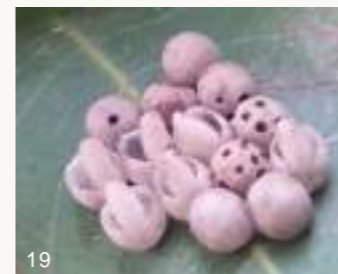
圖18~19. 龍眼葉背一批荔枝椿象卵，旁邊正有一隻平腹小蜂虎視眈眈地準備寄生（上圖）。14顆荔枝椿象卵（下圖），其中有6顆縱裂者為正常孵化成荔枝椿象一齡若蟲爬走，有4顆卵則每卵有1~7個圓孔，表示已經被跳小蜂寄生且羽化為小蜂成蟲飛離，另4顆則尚未孵化或羽化。