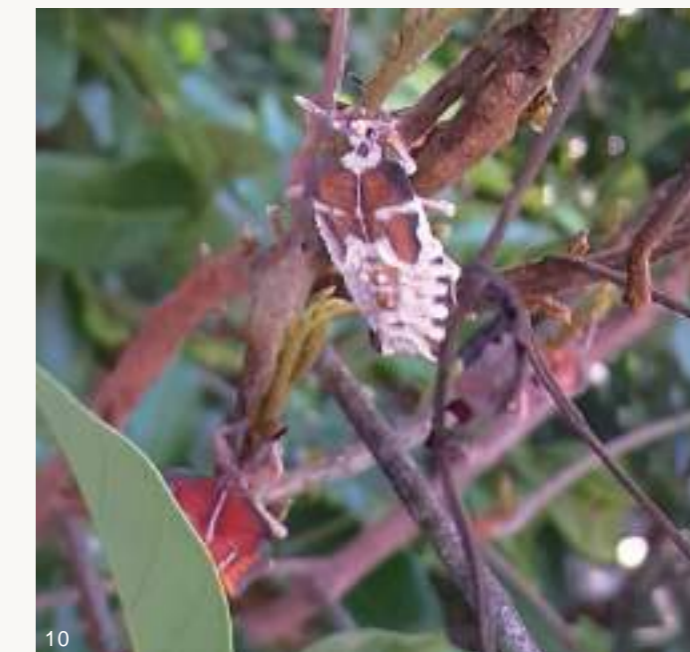
圖10~11. 108年梅雨季前後,大量荔枝椿象若蟲及成蟲感染蟲生真菌而死亡僵直掛在樹上,蟲體內白色黴菌從觸角、足、胸腹部等節間或氣孔、臭腺開孔長出。

寒流,荔枝及龍眼開花量豐,龍眼蜜產量足,但荔枝椿象族群密度也較高。相對的,108年首兩月平均日溫超過16°C為暖冬,無寒流,致使荔枝、龍眼開花結果少而歉收,龍眼蜜也幾乎無收,又加上108年梅雨季前後雨量充沛,若蟲及成蟲個體感染蟲生真菌死亡情形增加,使得該(108)年度荔枝椿象族群數量亦受到衝擊而大幅減少,與107年4~12月同期龍眼樹上荔枝椿象成蟲族群數量具明顯差異。