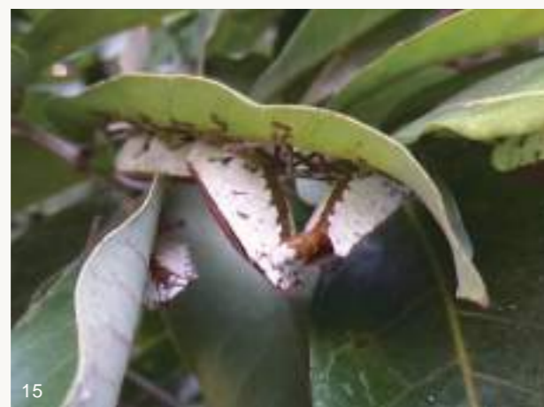
圖14~15. 一般來說，荔枝椿象通常喜歡在枝條或花葉芽上直立式交配，上方的雌蟲仍然邊交配邊吸樹汁（上圖）；剛打破越冬後在龍眼葉下水平式交配的情形則極為罕見（下圖）。