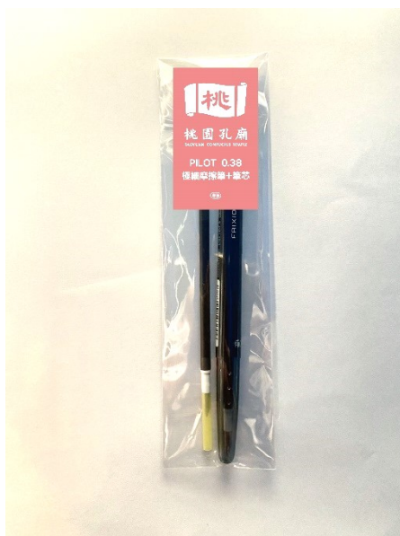
PILOT 0.38 摩擦筆-筆+筆芯一組